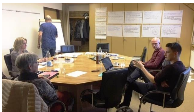
Sitzung noch ohne Video